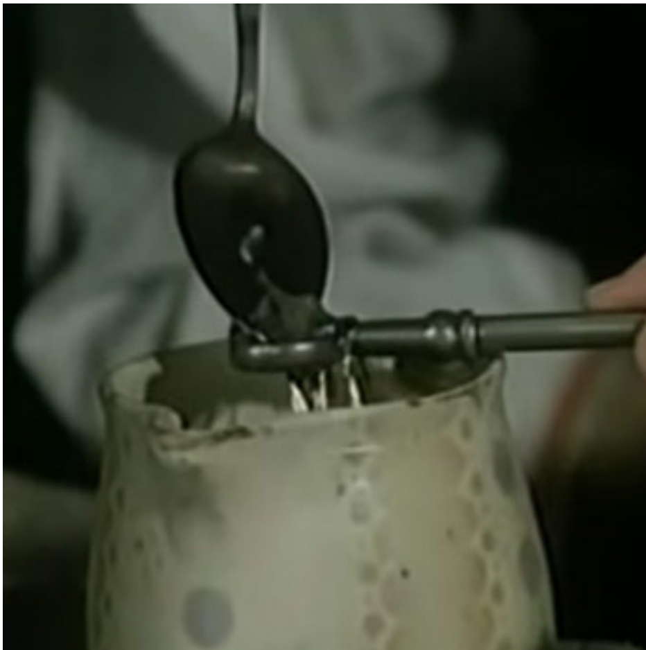
Obr.1 Liatie olova

Rozpustené ho preliali cez oko kľúča do nádoby so studenou vodou." Podľa toho aký tvar stuhnutý kov nadobudol (kladivo, husle, kosa atď.), také zamestnanie mal mať nastávajúci. V Telgárte liali olovo cez dierku kľúča, ktorý ukradli z dverí domu kde býval Ondrej a odriekali: „Ondreju, Ondreju na tebe olovo leju, daj že mi ty znať, koho budem za muža mať." Znáмым zvykom bolo aj trasenie plota pri dome, v ktorom býval Ondrej. Na Horehroní chodili dievky triasť ploty pri chlievoch. Podľa toho, koľkokrát ošipaná zakrochkala, o toľko rokov sa dievka vydá. V Nemeckej museli dievky nájsť plot s deviatimi stĺpmi. Po zatrasení a odriekaní prosby k Sv. Ondrejovi, čakali na prvého okoloidúceho muža. Jeho krstné meno mal mať aj ich nastávajúci. Aby dievky zistili za koho sa vydajú, varili halušky s lístočkami. Do cesta zabalili lístky s menom mládenca a hodili ich do vriacej vody. Prvá haluška, ktorá vyšla hore, obsahovala lístok s menom nastávajúceho. Dievky sa halušky snažili jedna druhej uchmatnúť. Aby sa čary podarili, museli byť múka, drevo a voda ukradnuté, najlepšie z domu, kde býval Ondrej.