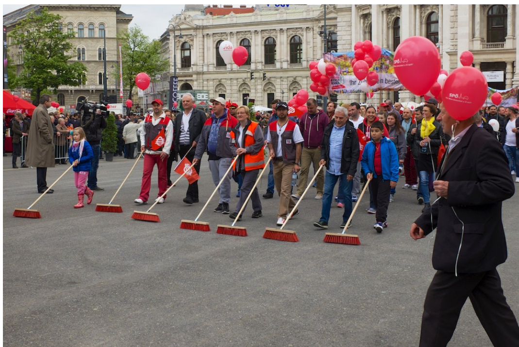
Wien - 1. máj