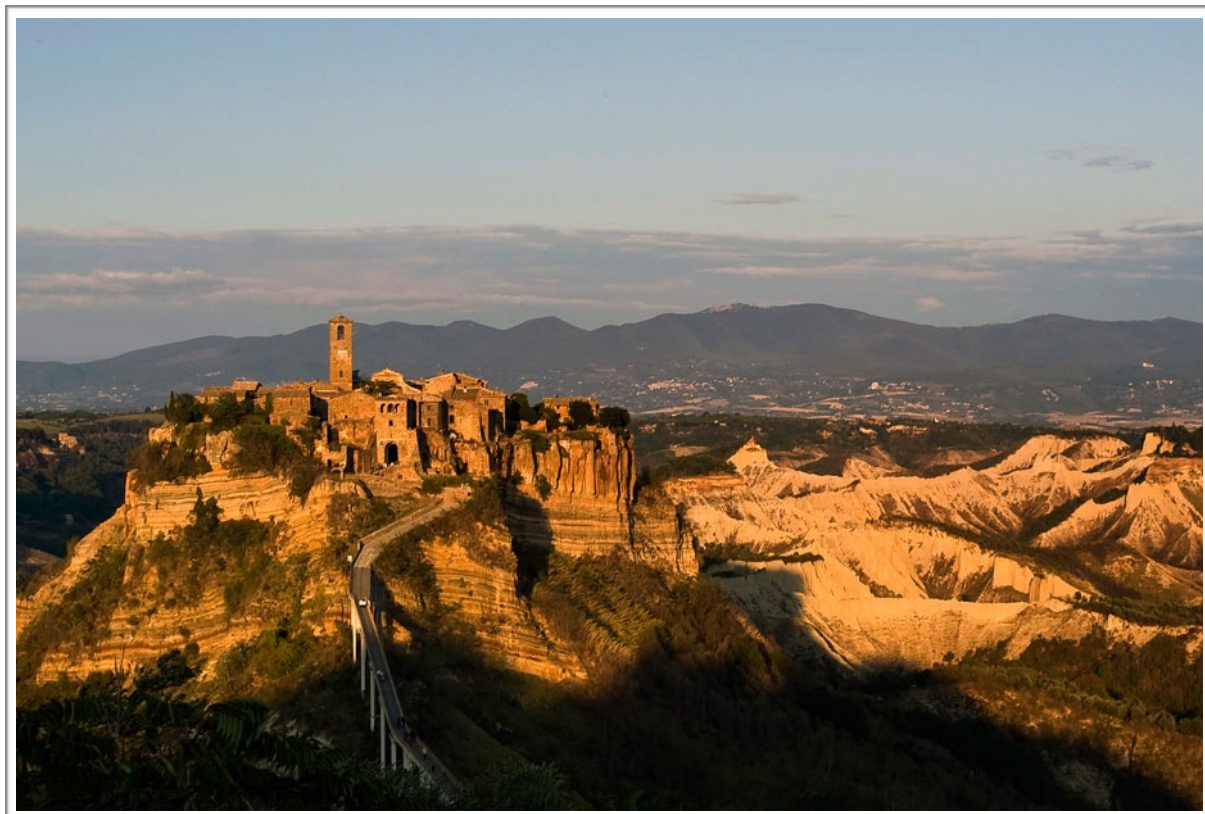
Civita di Bagnoregio

Bola raz jedna krajina a bol svet, ktorý bol rozdelený. Jedni boli dobrí a všetko vedeli a druhí boli zlí a nevedeli nič. Kým dobrí treli biedu a snívali, tí zlí si užívali a boli vždy usmiati. Potom prišiel ujo s červeným fľačikom na čele a povedal, že aj dobrí sa budú usmievať a cestovať aj mimo rezerváciu. Ak budú chcieť a nebudú sa báť zlých.